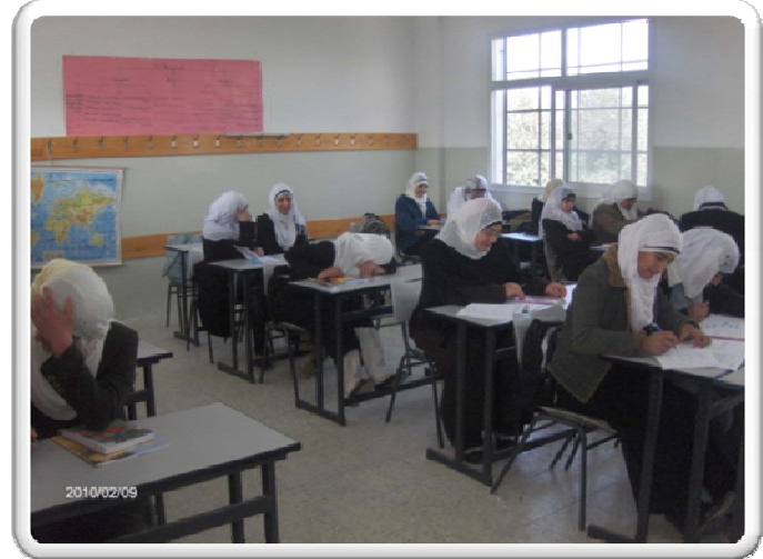
مدارس دير قديس - محافظة رام الله