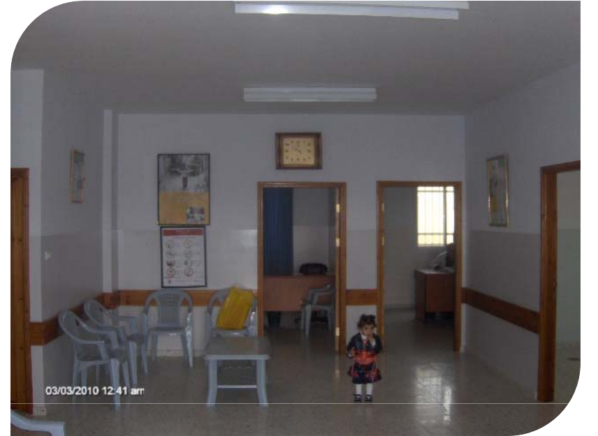
عيادة شوفة الصحية - طولكرم