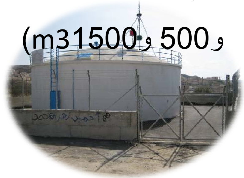
خزان مياه قطنة - رام الله