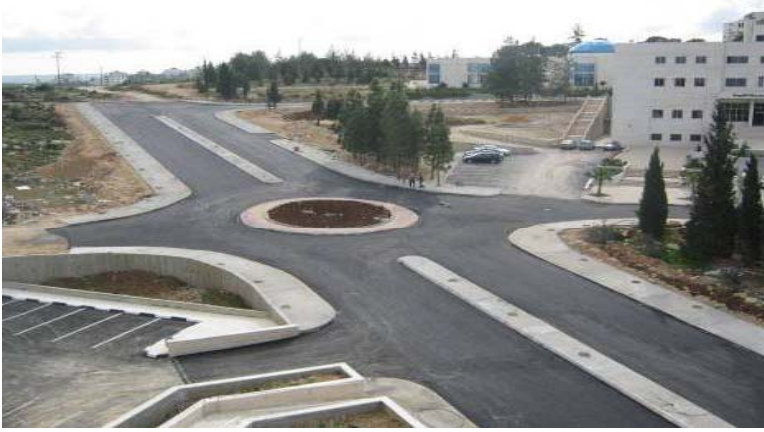
شارع تمريض بيرزيت - محافظة رام الله