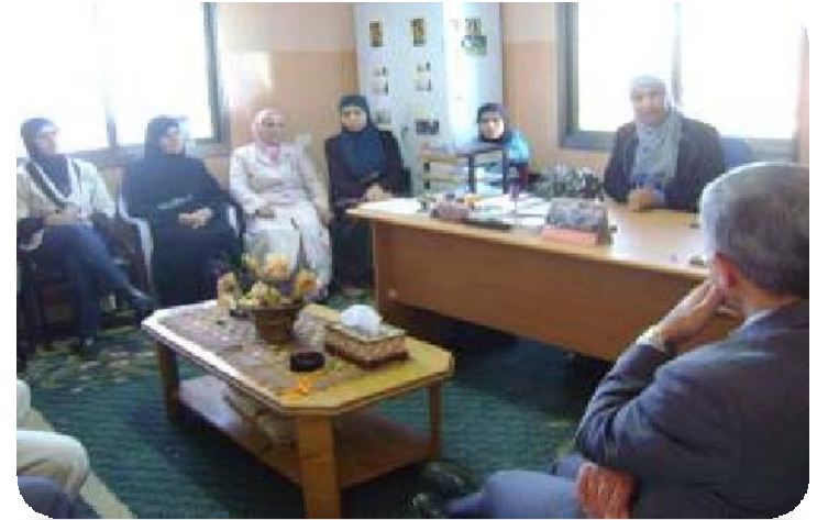
مركز المرأة الثقافي دورا - الخليل