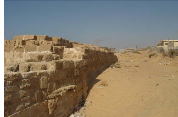
الحفاظ على السور الروماني في مخيم الشاطئ - غزة