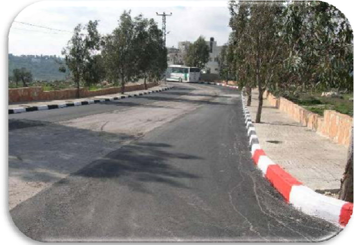
الجدران الاستنادية وأرصفة شركة رأس - منطقة طولكرم