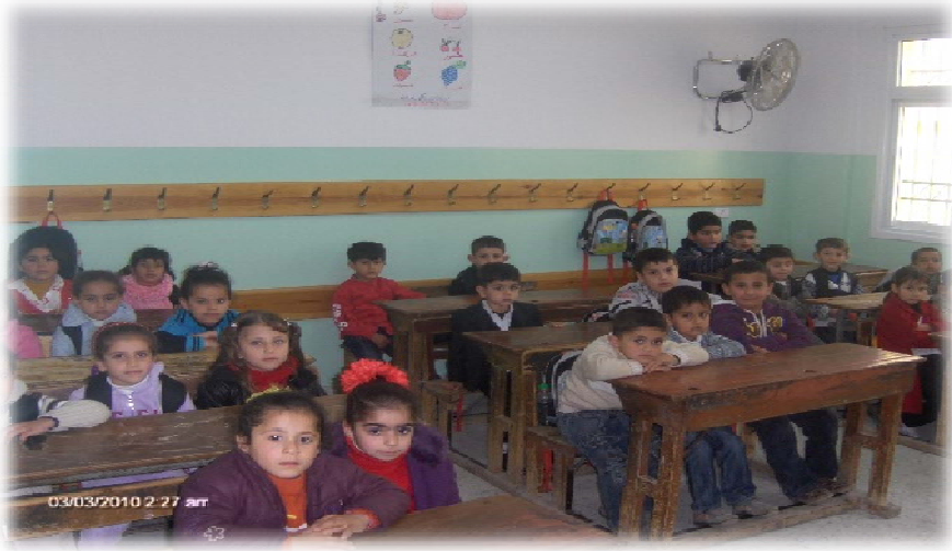
روضة أطفال نزلة عيسى - طولكرم