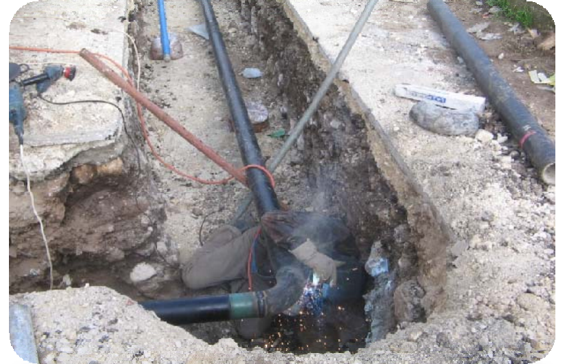
Beit Hanina Al Balad Water Network Jerusalem District