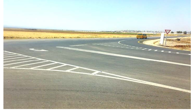
طريق الجلمة - محافظة جنين