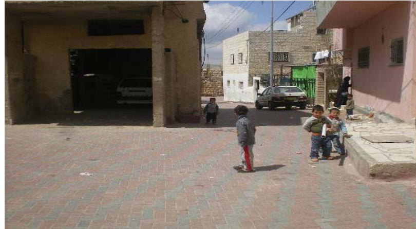
طرق حزما الداخلية - حي القدس