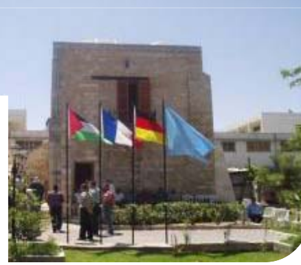
تجديد قصر الباشا - غزة