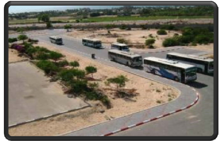
استكمال طريق جامعة الأقصى - خان يونس