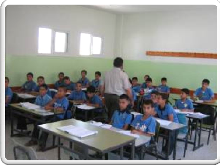
مدرسة بيت عوا - محافظة الخليل