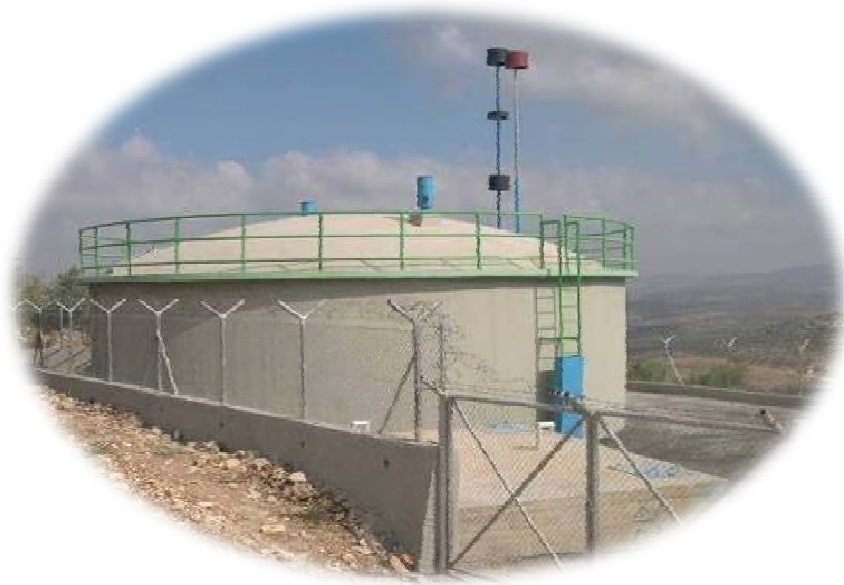
خزان مياه يعبد - جينين