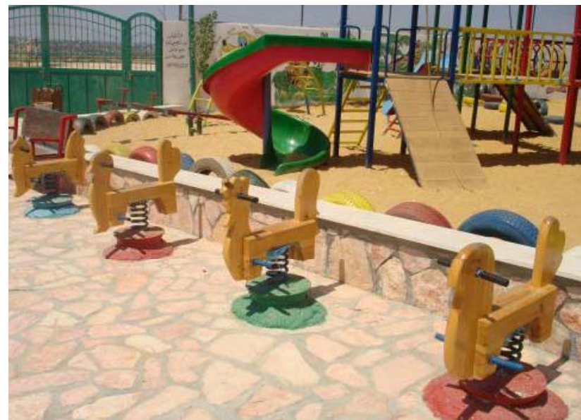
حديقة بلعين العامة - رام الله