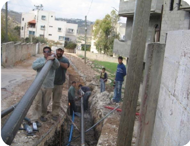
Qira Water Network – Salfeet District