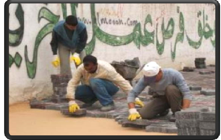
إعادة تأهيل الطريق الأقصى وغزة