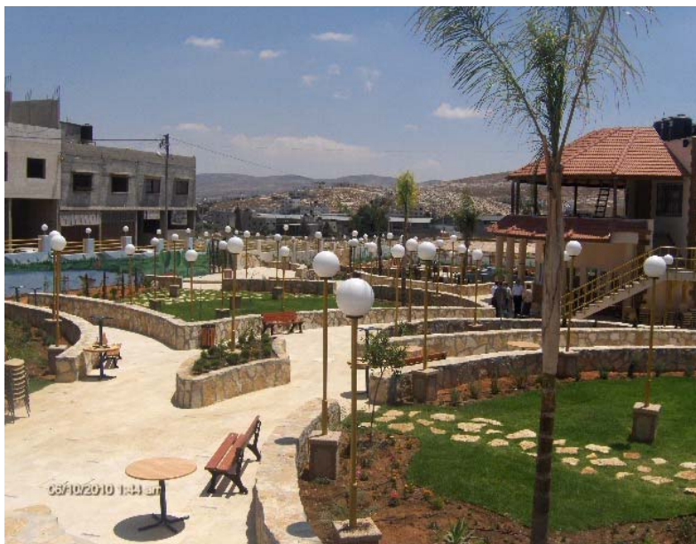
حديقة بلاطة العامة - نابلس