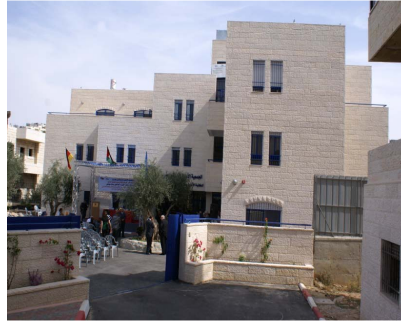
مدرسة الشروق للمكفوفين - محافظة بيت لحم