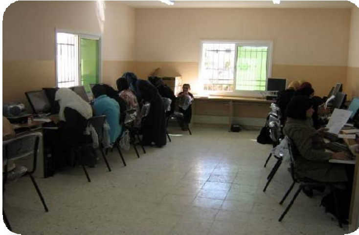
مركز بيت عمار - الخليل

● استفادت 154 امرأة من فرص عمل دائمة لتشغيل المراكز وآلاف آخرين استفادوا من مختلف البرامج التي تم تنفيذها