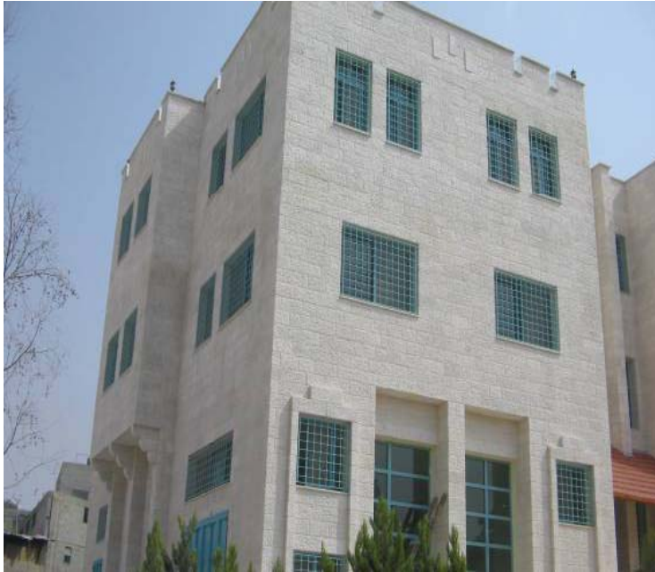
مركز الامل للصم - محافظة قلقيلية

© تم تنفيذ 7 تسهيلات لذوي الاحتياجات الخاصة