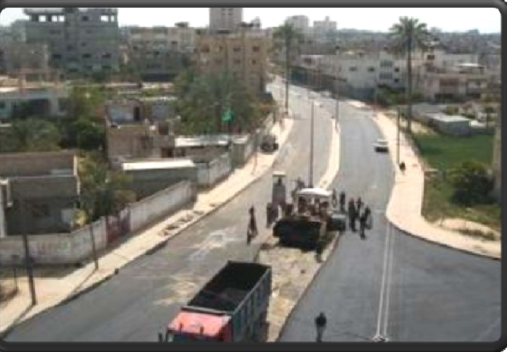
إعادة تأهيل منطقة المحطة، خان يونس