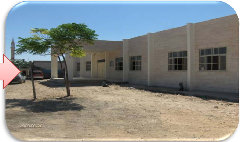
مدرسة العرب الجهالين - حي القدس