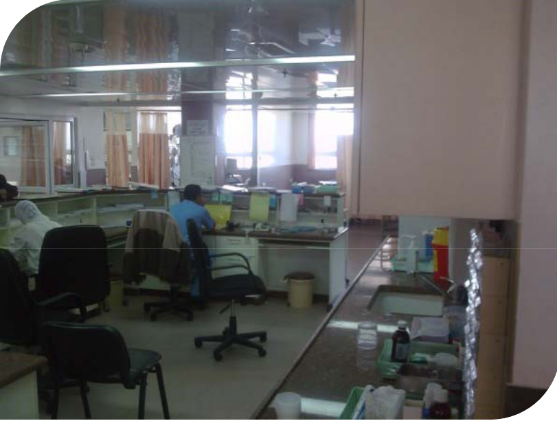
مستشفى المقاصد - حي القدس

عيادات في المجتمعات الريفية فضلا عن وحدات للقلب والجراحة في المستشفيات الخيرية