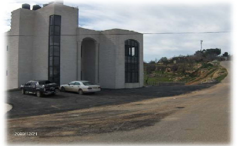
Betounia Six Association Building – Ramallah District