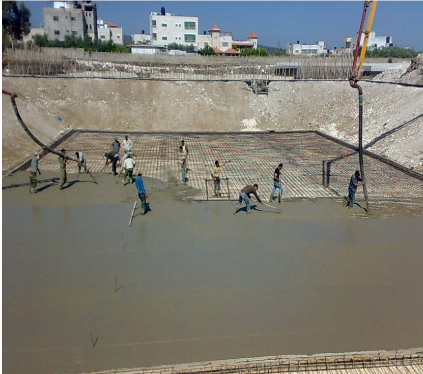
محطات معالجة مياه الصرف- جنين