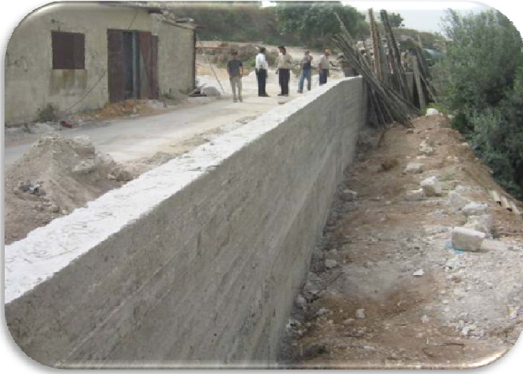
جدران قباطية الاستنادية - محافظة جنين