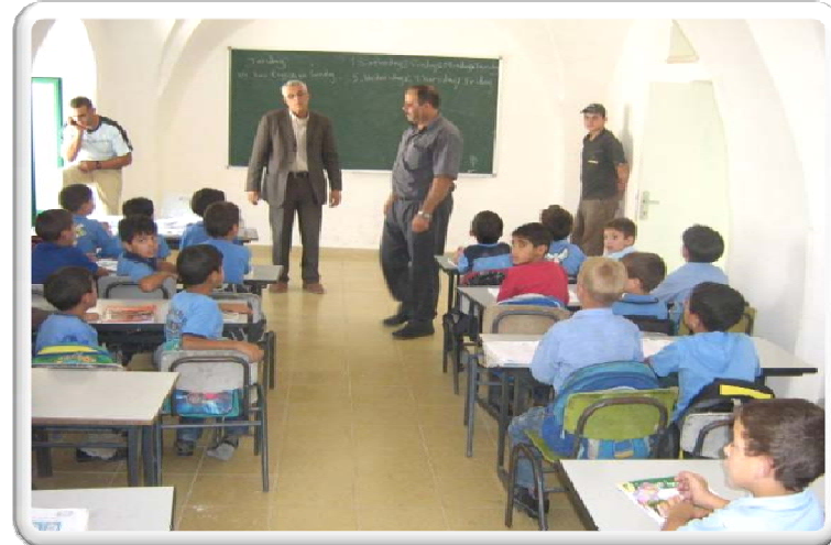
مدرسة اليقظة - بلدة الخليل القديمة