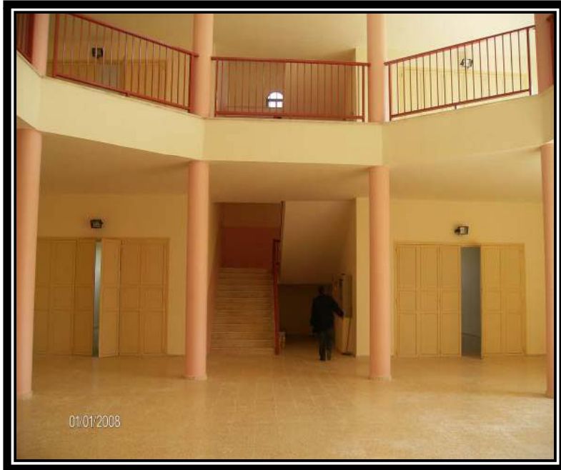
منطقة سلفيت الصناعية - منطقة سلفيت