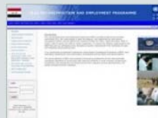
UNDP Project (IREP) Implemented by BDS