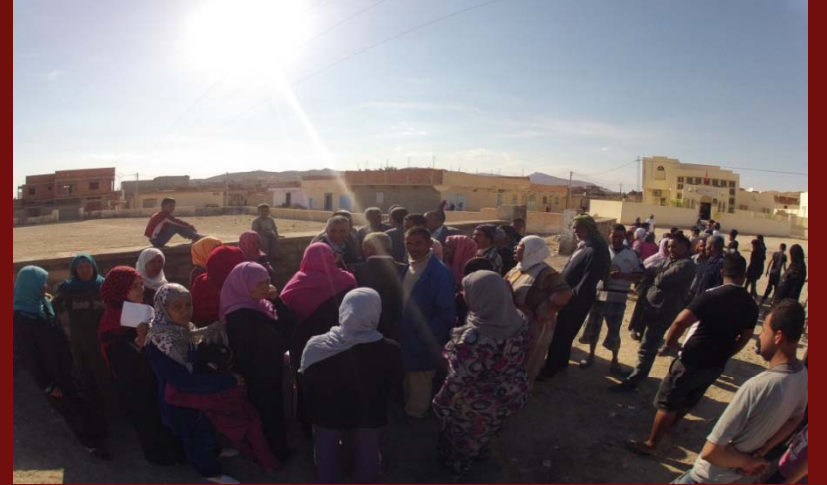
لقاء مع متساكني حي السرور