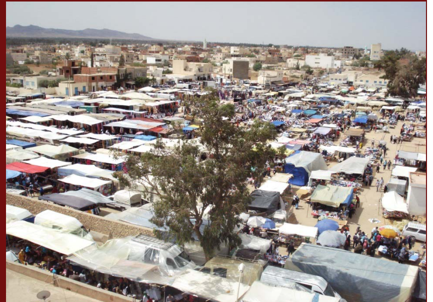
متدرب في قطاع خشب الزيتون

فضاء السوق الاسبوعي في سيدي بوزيد: تهيئة جزئية باعتماد مقاربة HIMO