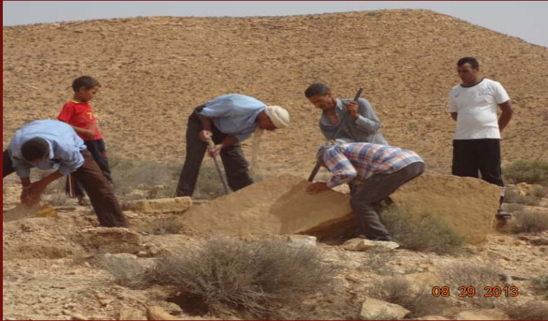
تثمين الحجارة المحلية بسيدي عيش في مشروع تهيئة السوق

تهيئة سوق بحي السرور. طلب متساكني الحي، تثمين الحجارة المحلية (سيدي عيش) مع امكانية الربط بين منتجات الحليب بسيدي عيش و السوق الذي المبرمج بحي السرور.