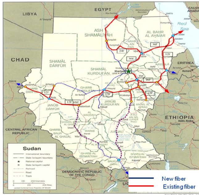
National fiber track map